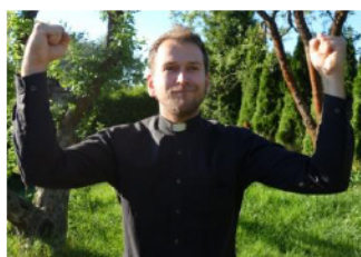
Jan Hus Žižkův mluvčí