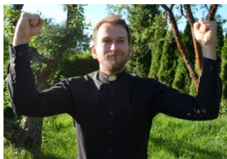
Jan Hus žižkův mluvčí